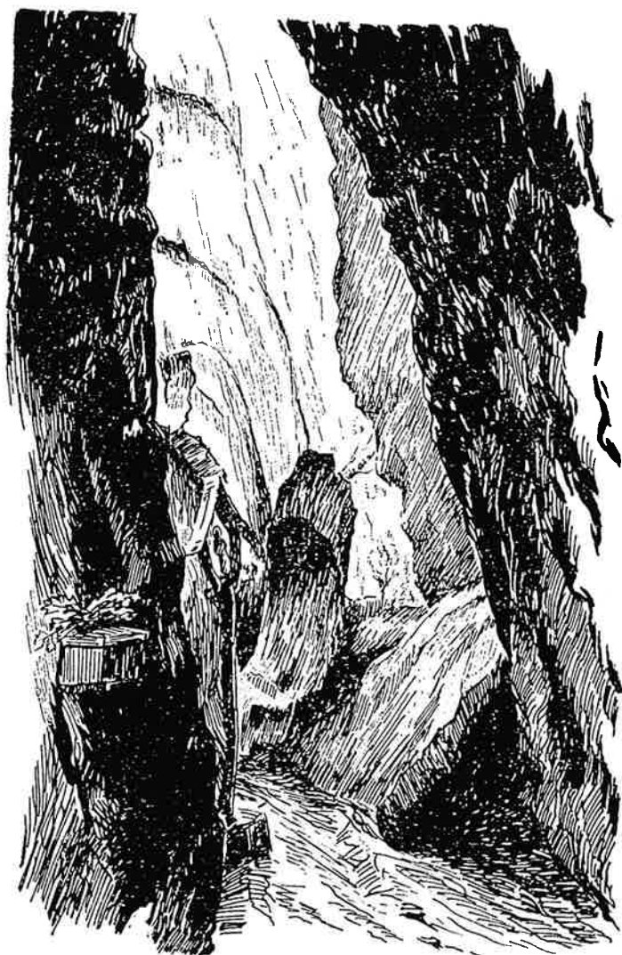
Dibuix de la Font del Llum amb la capelleta, fa anys desapareguda, que segons Pere Bosquets era dedicada a la Mare de Déu del camí.

Les referències més antigues que hem localitzat són coetànies a la descripció que acabem de reportar. La Font del Llum s'esmenta en el mapa de la muntanya de Montserrat que aixecà, el juliol de 1798, el geòmetre barceloní Francesc Renart. Hi situa, amb el número 37, la Fuente del Llum . 6 També, en les magnífiques vistes de la muntanya dibuixades, en les mateixes dates, per Pere-Pau Montaña, i conservades a la Biblioteca de Montserrat, Ms. núm. 1135, s'esmenta, en la làmina IV, número 7, la Font del Llum . 7