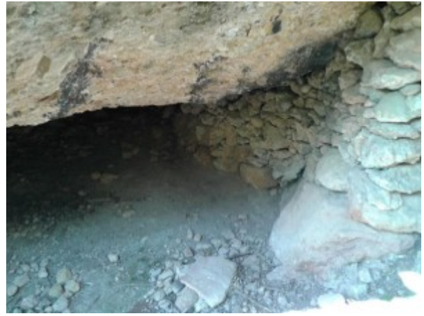
Cova d'en Claramunt

Una altra balma ressenyada per en Joan Vidal Reina és la denominada balma de la Canal Roja, sota la placa dels Roofs, a Ecos.