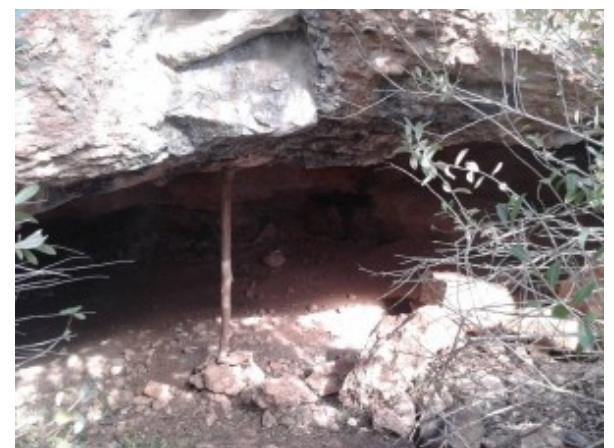
Balma de l'Era dels Pallers