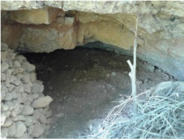
Cova d'en Claramunt