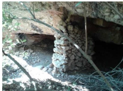
Cova d'en Claramunt