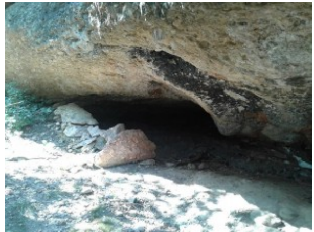
Balma de la Canal Roja

La balma de l'Era dels Pallers la citen Joan Vidal Reina i Manel Punsola