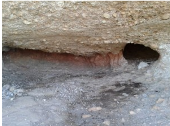
Forat del Faraó

En Joan Vidal Reina descriu a la cara oest de la roca del Faraó un forat que dóna entrada a una sala prou àmplia per acollir-hi còmodament a tres persones.