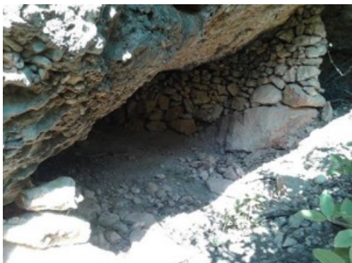
Cova d'en Claramunt

Hi ha informació sobre algunes balmes escampades per la muntanya. En Joan Vidal Reina en proporciona sobre la cova d'en Claramunt o cova dels bastons, aprop de l'agulla Zanini. Aquesta balma fou habitada per una persona després de la Guerra Civil durant una temporada.