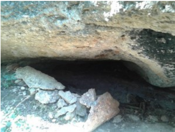
Balma de la Canal Roja

Una altra balma ressenyada per en Joan Vidal Reina és la denominada balma de la Canal Roja, sota la placa dels Roofs, a Ecos.