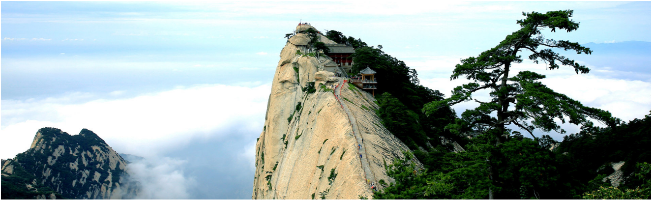
Hua Shan, muntanya sagrada del taoisme a Xina

Un altre indret amb una morfologia singular similar al massís montserratí és l'anomenat "bosc de roques" de Meteora, al centre de Grècia, a la regió de Tessàlia, és una espectacular formació de conglomerats terciaris. Les cingleres de Meteora, sense ser massa altes, s'eleva en esveltes agulles similars a les montserratinas. Sis petits monestirs bizantins coronen algunes d'aquestes agulles. Segons les antigues tradicions, aquestes agulles són roques que el cel va enviar a la terra perquè els ascetes tinguessin un lloc on retirar-se per a la pregària.