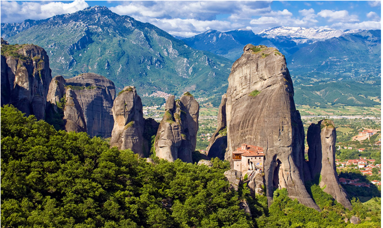
Bosc de roques de Meteora