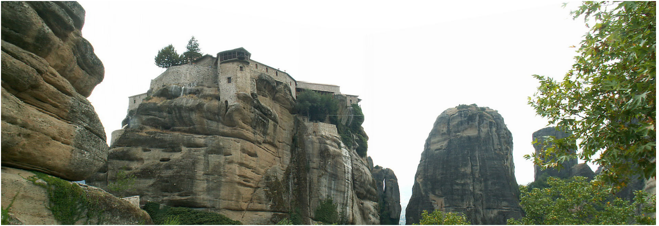
Bosc de les roques, Meteora.