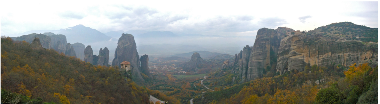
Bosc de les roques, Meteora.

La distància dóna una perspectiva interessant a la mirada del paisatge. El perfil montserratí ha estat captivador de moltes mirades que l'han dibuixat o fotografiat procurant retallar les agulles montserratines sobre el cel.