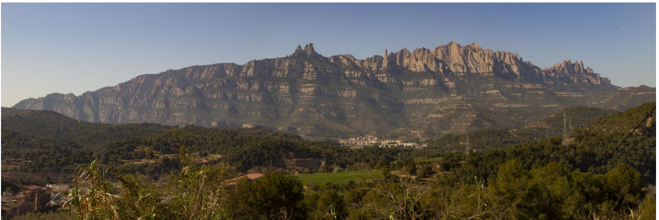
Fotografia de Montserrat feta des de l'estació de Renfe de Castellbell i el Vilar, des del mateix indret on J.E.Esplugas fue una fotografia el 1892

En l'article Montserrat, una realitat contemplada i intepretada es descriuen els diferents moments en la quals la realitat geogràfica ha estat interpretada per la mirada observadora. Tota realitat és sempre interpretada pel seu observador per tal de ser comunicada. El text transmet un sentit de la realitat evocadora de sentiments i sensacions. La mirada interpreta aquesta realitat i suscita pensaments i reflexions. Al final, la realitat es converteix en un discurs articulat. Aquest, alguns cops s'explica en forma de llegendes o relats fantàstics; en altres moments es converteix en una definició tancada que li resta expressivitat. Montserrat, com diu Francesc Roma i Casanovas, en la seva tesi doctoral La construcció medial de la muntanya a Catalunya , perdura al llarg del temps perquè descansa sobre diversos discursos. Qualsevol mirada a la realitat, a més de definir