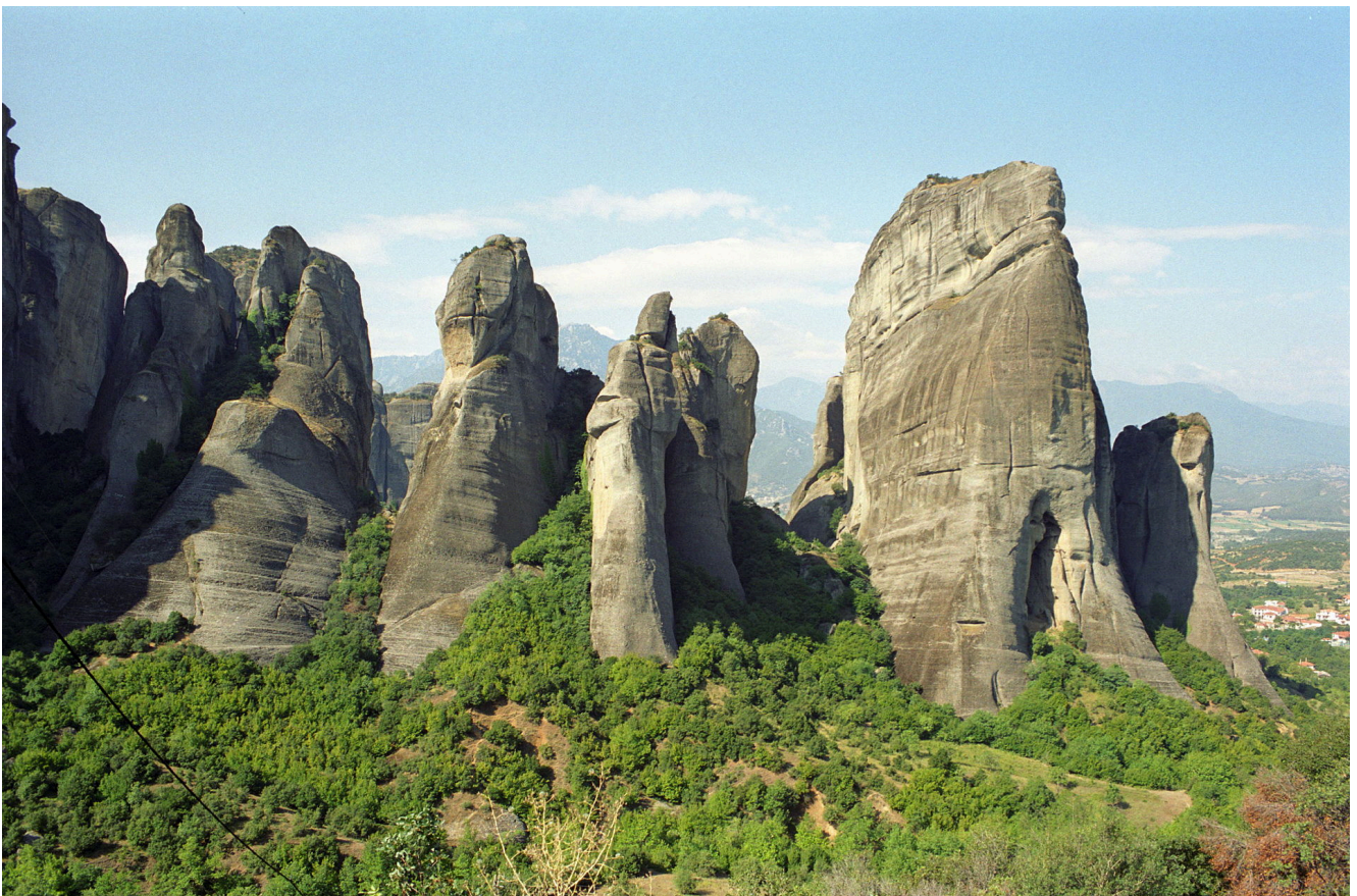
Bosc de les roques, Meteora.