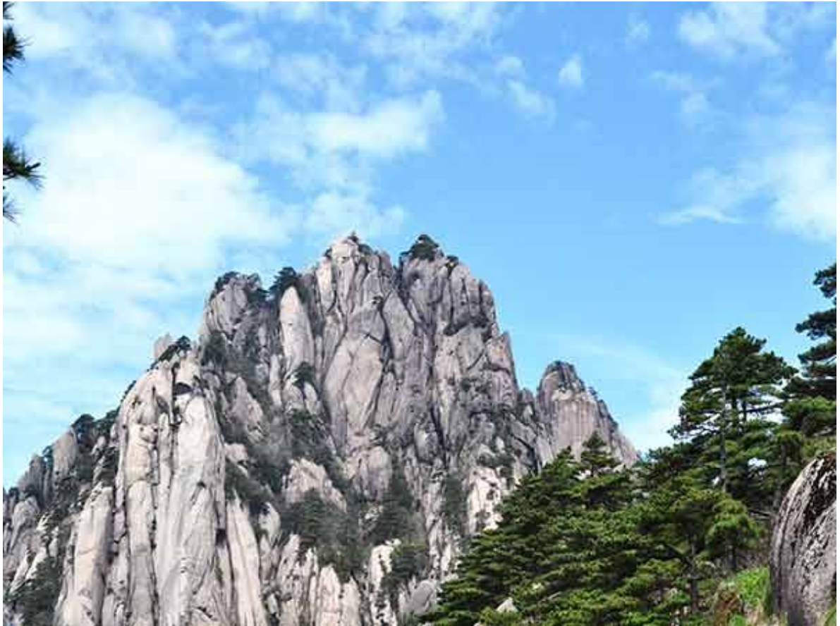
Hua Shan, muntanya sagrada del taoisme a Xina