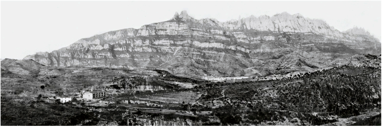
Fotografia de J.E.Puig, 1892 feta des de l'estació de Monistrol-Nord, Castellbell i el Vilar