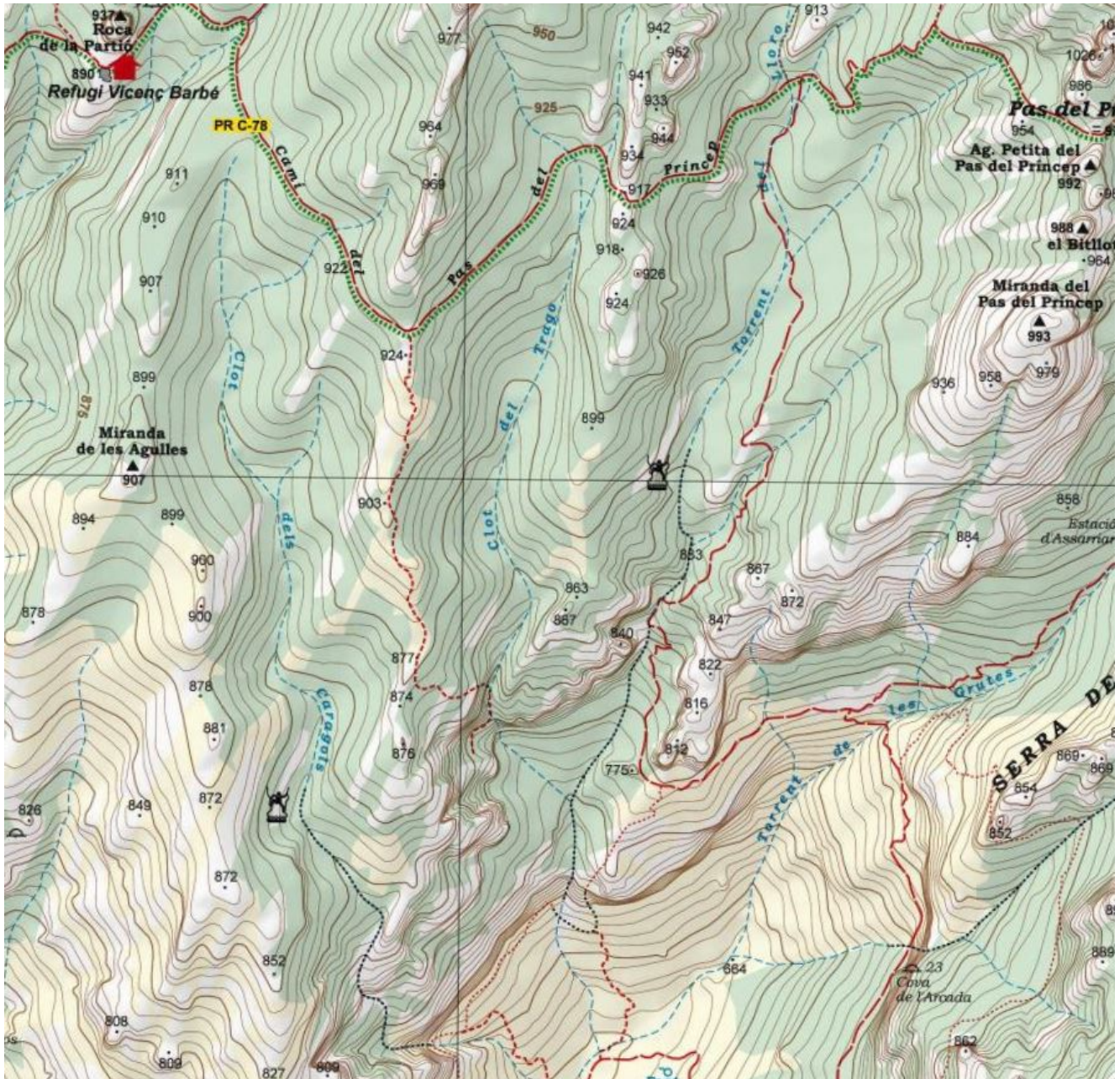
Detall del mapa de l'editorial Alpina

La cartografia de l'editorial Alpina representa perfectament la situació i recorregut d'aquests torrents, però no així la cartografia de l'Institut Cartogràfic i Geològic de Catalunya que anomena torrent del Trago al torrent dels Cargols i deixa sense nomenar el torrent que conflueix amb el torrent del Lloro i que és realment el torrent del Trago. Certament, un petit embolic. Un embolic més en la toponímia del massís montserratí.